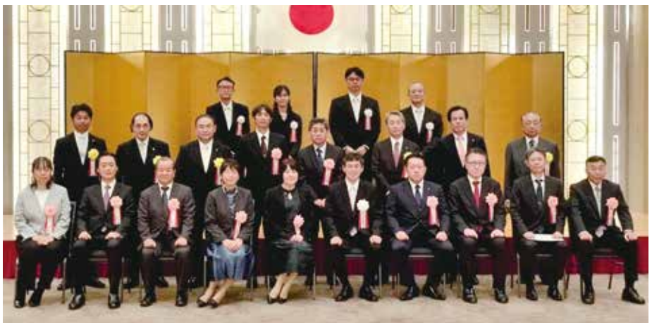
千葉東税務署長感謝状