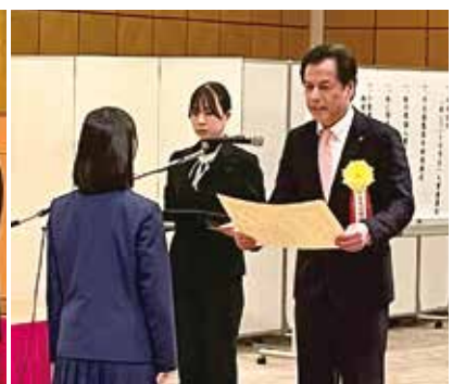
「税についての作文」入賞者を 表彰する今野会長