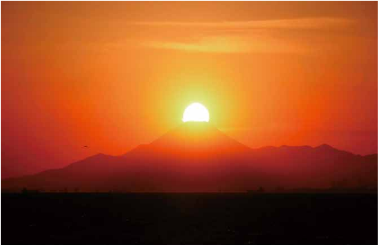
ダイヤモンド富士