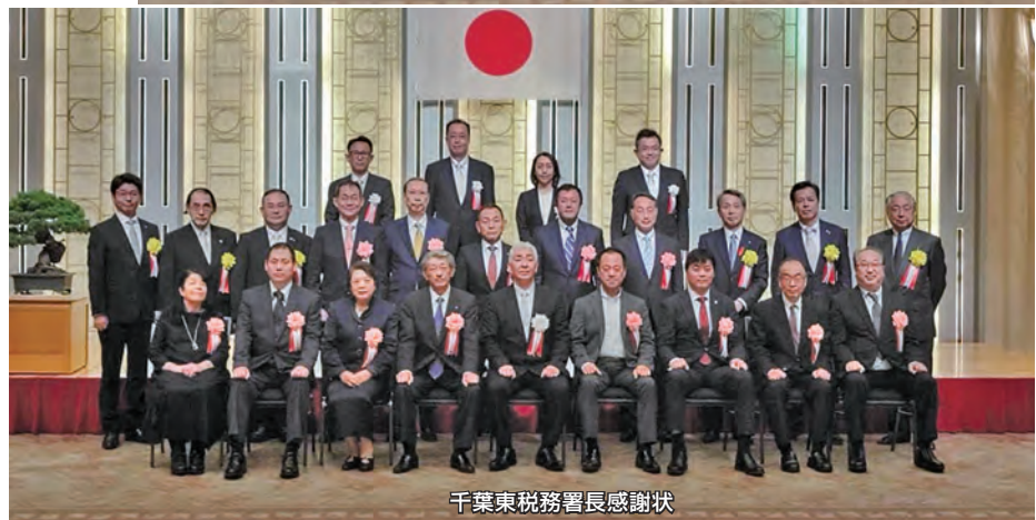
千葉東税務署長感謝状