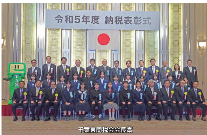
千葉東間税会会長賞