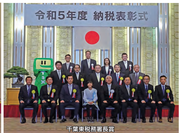
千葉東税務署長賞