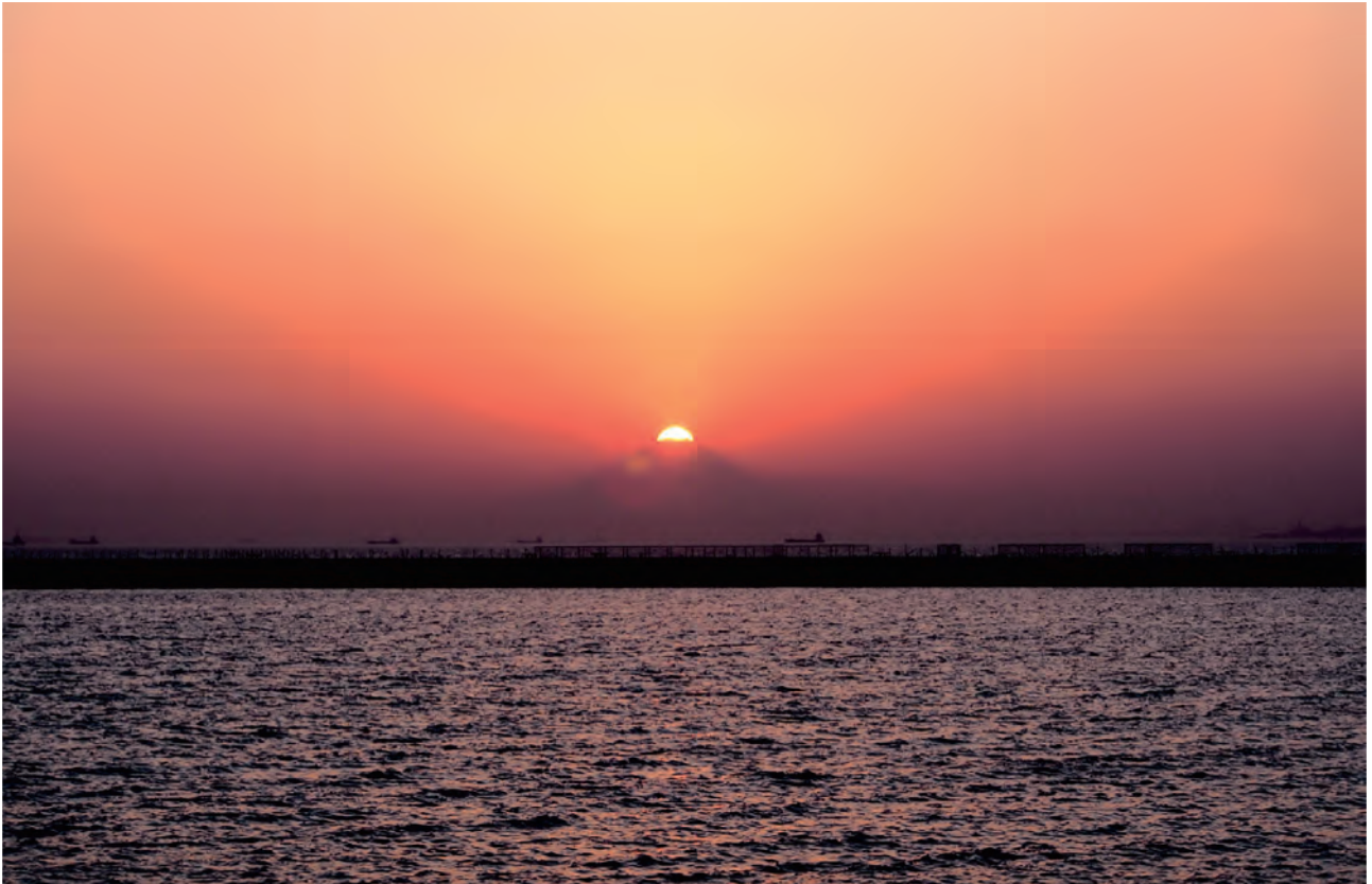
ダイヤモンド富士