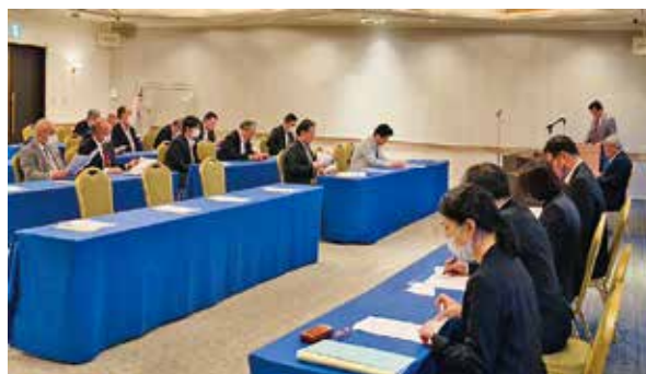
署から4名のご来賓を迎えて今野副会長の司会で開会