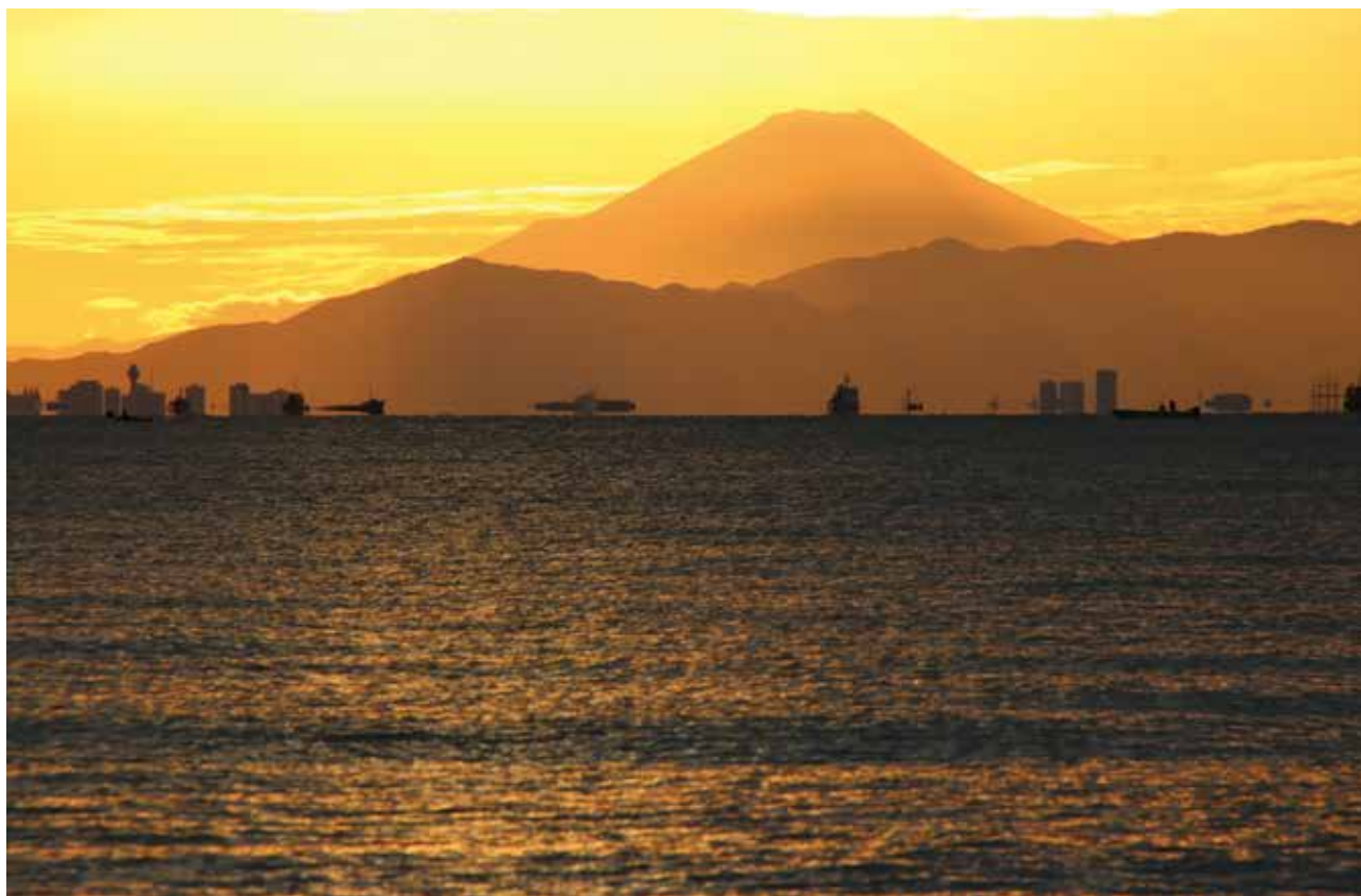
東京湾越しの富士